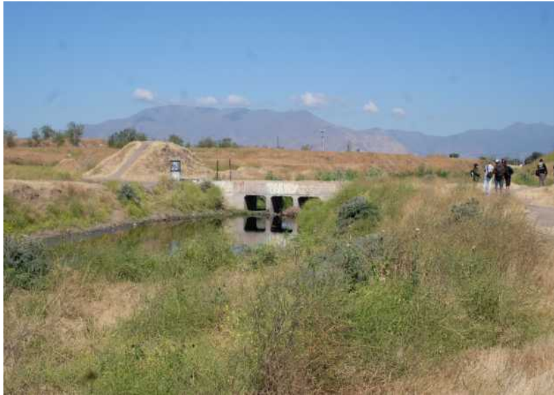
Humedal O'Higgins, Quilicura, 2025.

Para terminar, dejo al lector con esta foto de los humedales y su extraño puente de hormigón, cuya leyenda será la cita de Édouard Glissant: