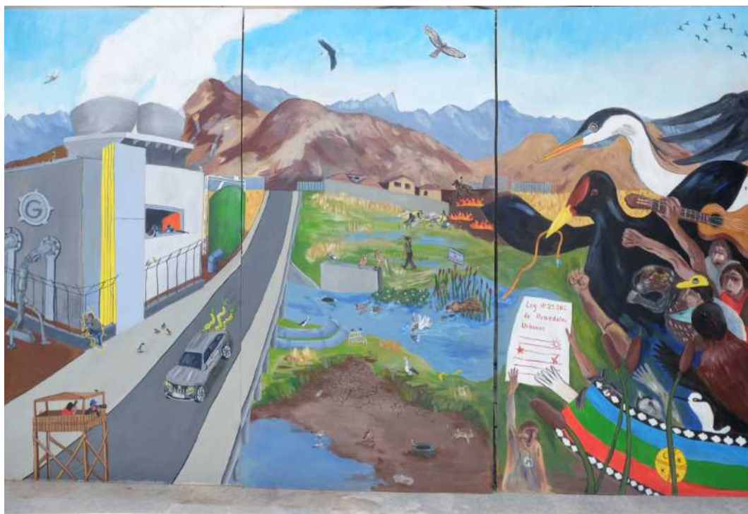
Quilicura, acrílica sobre madera, 140 x 240 cm, 2025.

vida casi pacífica, mi imagen mental de los humedales sin sus beligerantes (si no miramos los incendios frecuentes, los animales muertos y las tierras secas...). Se pueden ver actividades como la tala de totora, y en el centro, el Estero Las Cruces que alimenta los humedales. Al fondo, representé los tres cerros, dominados por la Cordillera, por supuesto la entidad más importante de todo el país.