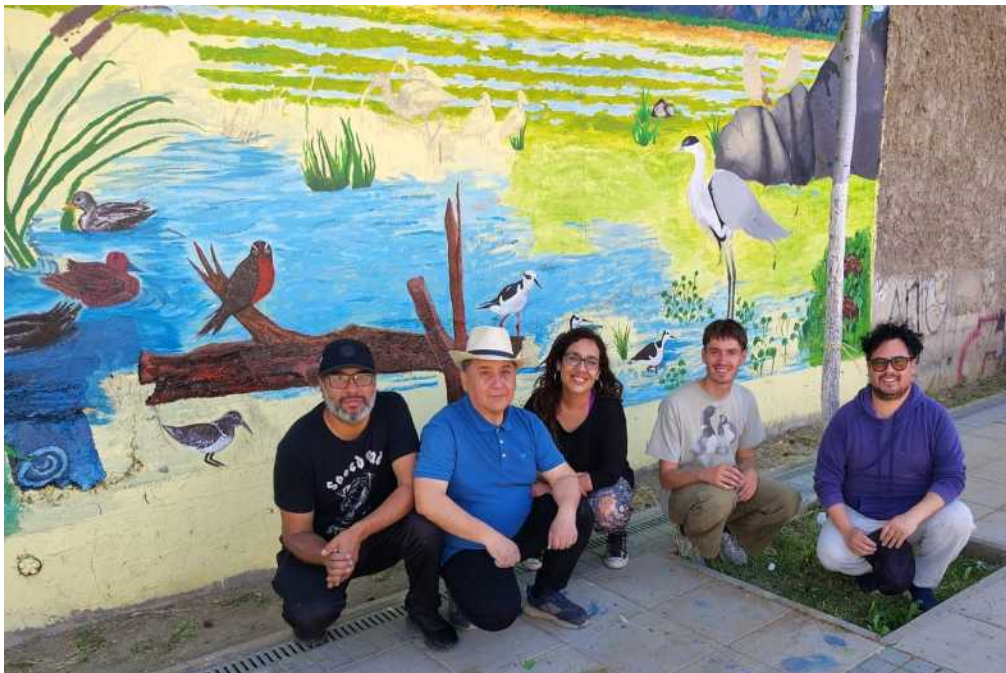
Mural en el liceo bicentenario de Quilicura, con Corporación Ngen

Los dos grupos con los que colaboré son Corporación Ngen y Resistencia Socioambiental Quilicura (RSQ). Estos colectivos llevan a cabo numerosas acciones de educación, como, por ejemplo, prevención en las escuelas, conferencias y eventos en los humedales, jornadas de fotografía, caminatas, entre otras, intentando llegar a un público diverso. Tuve el placer de ayudar a la Corporación Ngen a realizar un mural en el Liceo Bicentenario de Quilicura.